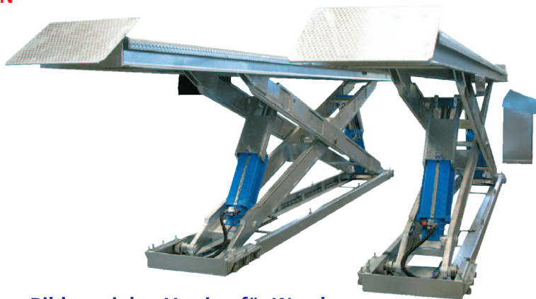
Bild verzinkte Version für Waschaum bei Garage Sommerhalder - Rickli in Murgenthal